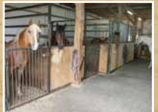
Täglicher Koppelgang ist Garant für die Gesundheit der Pferde.