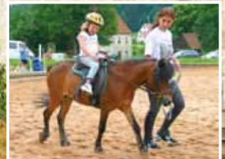
Man kann nie früh genug mit dem Reiten beginnen. Unsere Ponys Bobby und Karo erwarten Euch.