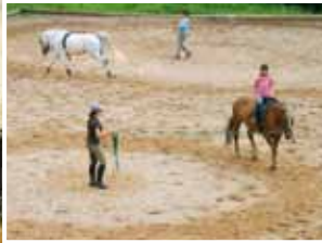
Die ersten Reitstunden an der Longe mit unseren gutmütigen Pferden schulen den Sitz und geben Sicherheit auf dem Pferderücken.

Willkommen in der freundschaftlich, familiären Atmosphäre im Kanneshof. Unser denkmalgeschützter Hof verbreitet einen Charme, dem man sich nicht entziehen kann. Einfach durchatmen, den Alltag vergessen und die Natur intensiv erleben.