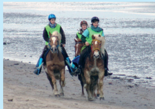
Spaß am Strand!

Sonstiges - national - Ritt und Fahrt - zusätzlich Kinderritt 7 km - Teilnehmerbegrenzung: 120