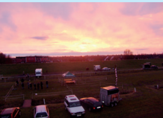
Sonnenuntergang auf der Jaderrennbahn